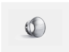
00-01002 reflektor 32°