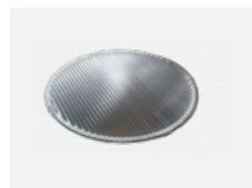
00-01101 Lineární optický systém