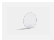
00-01100 Satinovaný difuzor