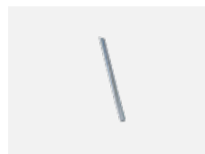
00-00355, K vodič 5x0,75 2000mm