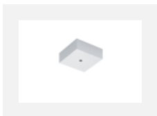
00-00370, W kalíšek stropní 80x80x32mm