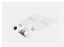
00-20101, W 2xkoncovka - kov, 5pól.svorkovnice, průchodka