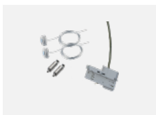
00-51301, W sada pro zavěšení do 3f lišty, pro stmívatelná svítidla