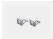
00-20700, W 2 ks úchytu na stěnu Lipo/Lina