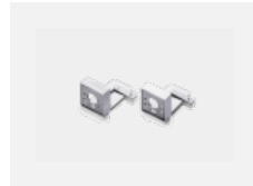
00-20700, S 2 ks úchytu na stěnu Lipo/Lina