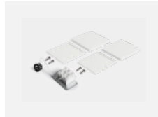
00-20100, S 2xkoncovka - kov, 3pól.svorkovnice, průchodka