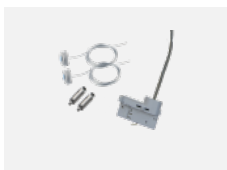
00-51300, W sada pro zavěšení do 3f lišty, pro nestmívatelná svítidla