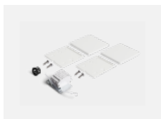
04-20103, W 2xkoncovka - plast, 5pól.svorkovnice, přůchodka