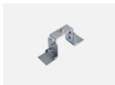
04-20900, F sada pro vestavbu závěsného profilu jako bezrámečková montáž