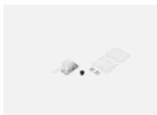
04-20101, W 2xkoncovka - kov, 5pól.svorkovnice, přůchodka