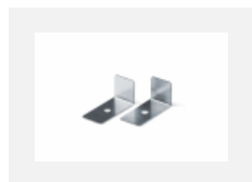
04-01200, F příslušenství k demontáži el. modulu z profilu